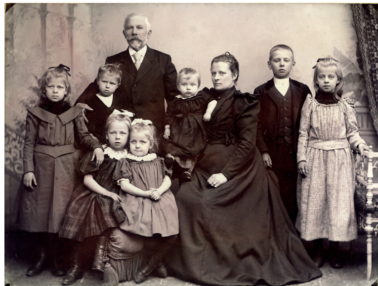
Familjen Wallengren

Avgift 400 kr/person. OBS! Begränsat antal platser. Föranmälan senast fredag 16 januari kl 12.00 endast till tel. 0722 – 33 18 58