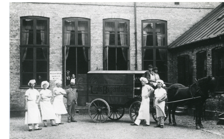
Lunds bageriförening Brödvagnen färdiglastad.