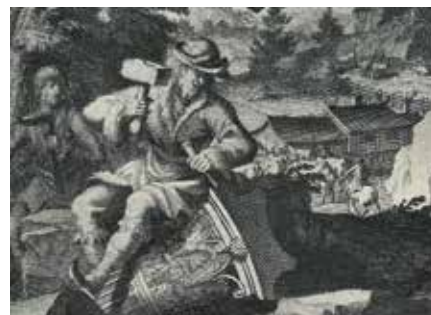
Utsnitt från Suecia antiqua et hodierna av Erik Dahlberg, public domain