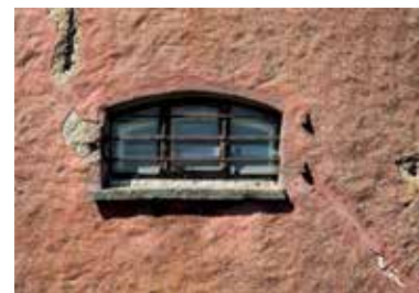
Cellfönster från straffängelset i Varberg.